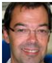
J-Marc B E3 - MF1 Scaph & Apnée