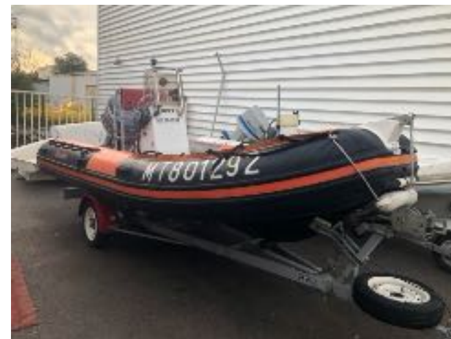
5 m, moteur 85 hp, capacité 6 plongeurs

Selon le calendrier des activités, les sorties s'effectueront avec notre bateau, du bord ou dans des clubs extérieurs.